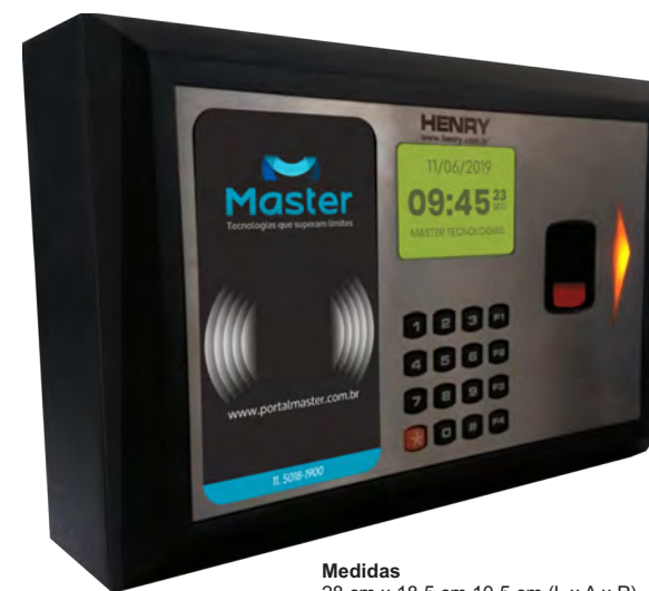
Medidas 28 cm x 18,5 cm 10,5 cm (L x A x P)

Não permitir a alteração ou eliminação dos dados registrados pelo empregado.